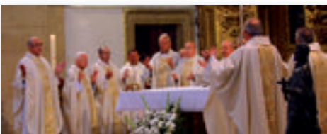
Celebración Bodas de Oro Sacerdotales (Pág. 5)

Debemos tener un espíritu crítico frente a la comunicación. Y generar en el seno de nuestras comunidades cristianas espacios de comunicación auténtica, de tú a tú, cara a cara, desde la escucha y el diálogo. Favorecer un estilo comunicativo abierto y creativo que nos permita comunicar esperanza y confianza, y ofrecer a los hombres y a las mujeres de nuestro tiempo narraciones marcadas por la lógica de la «buena noticia».