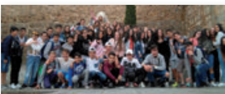
Asignatura de Religión (Pág. 2)